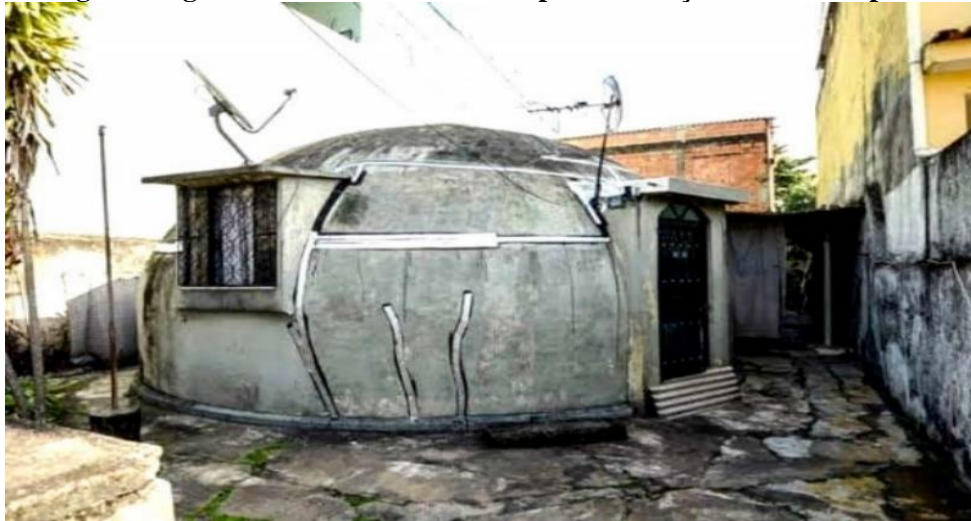
Figura 2. Iglu de Concreto Construído pela Fundação da Casa Popular