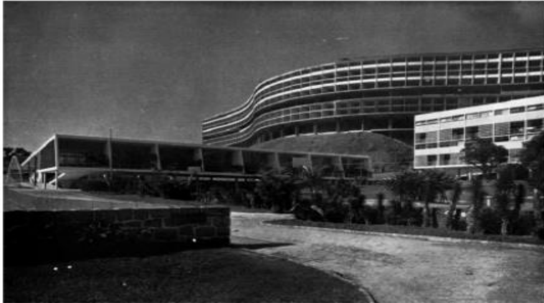
Figura 1: Fotografia do Conjunto Pedregulho

elaborar e materializar projetos com arquitetura modernista de alto nível de sofisticação, como pode ser visto na Figura 1 abaixo.